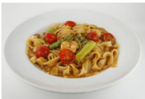
ペスカトーレきしめん（カレー味）