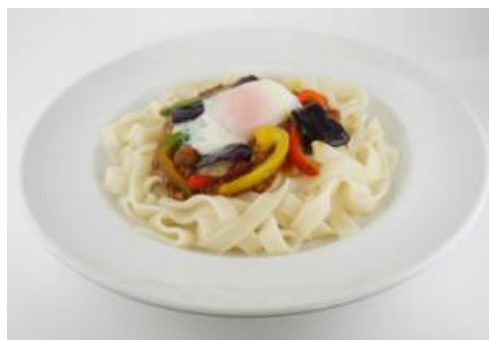
キーマカレーきしめん